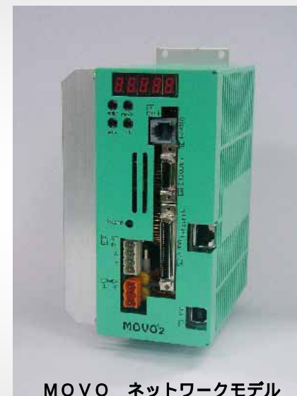
MOVOR ネットワークモデル